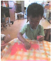
こんなにちいさく なったよ！

色をつけた寒天を机に置くと、嬉しそうに席に着く子どもたち、椅子に座り、楽しいことが始まりそう！と期待に胸を膨らませて、ニコニコ笑顔でジーと見つめています。担任が寒天を持って「ツン！ツン！」触ってみるとプルプル動く様子に笑い始め、手に持って透かして見ると友だちの顔が見えることがわかると目をキラキラさせながら、一緒にのぞき込みました。触ってみると「つめたーい！！」気持ちよさそうになでたり、両手でもみもみしたり、ちぎってみたり、思い思いの方法で楽しみました。赤・黄・緑、色づけされた寒天を指差して「あか！」と言ったり、色が混じっていく様子を友達同士見せあいながら、寒天のプルプルした感触、冷たさを感じながら楽しむことができました。