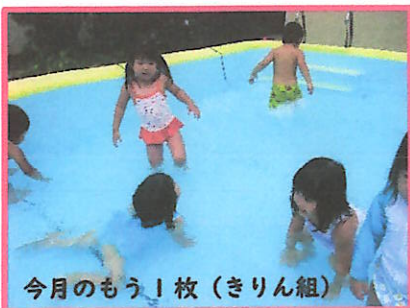
今月のもう1枚(きりん組)