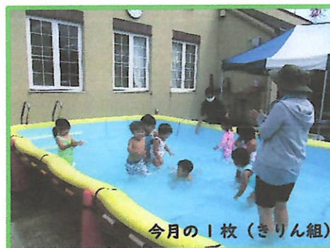
今月の1枚(きりん組)

※21(土)の就労保育は0,1歳児のみとなっております。2歳児はご家族でたいいくあそびをご参観いただけます。